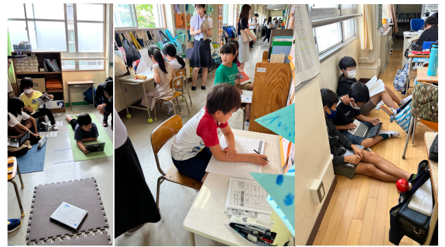
思い思いの場所で学ぶ子どもたち。