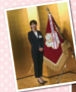
▲垂水消防団70周年記念式典司会