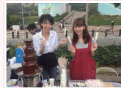
▲あじさい祭りに参加