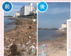
塩屋海岸 清掃ボランティアに参加 ▲