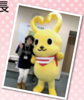
▲シングルマザーフォーラム お手伝い